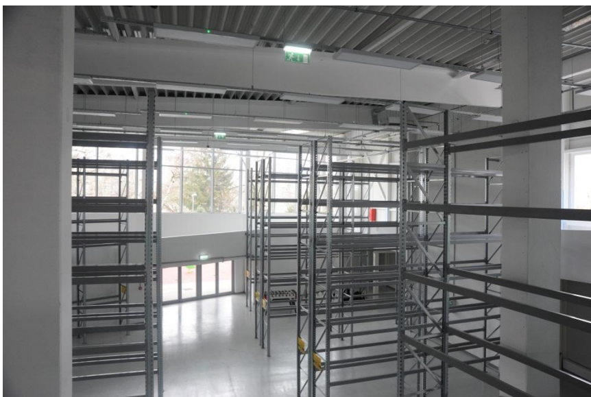
Magas raktár (üzemi terület)