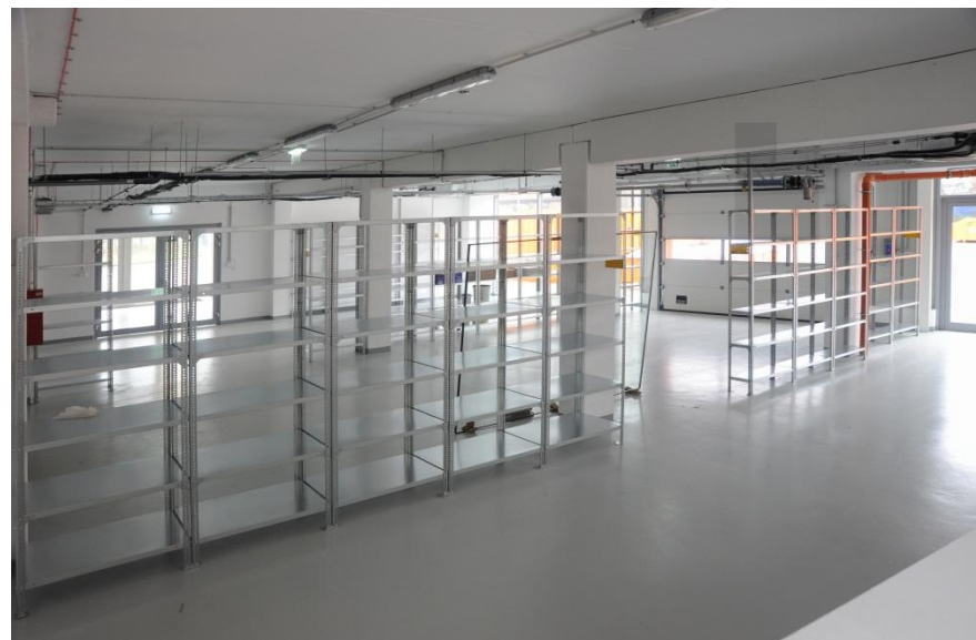
Reuse alacsony raktár (piactér)